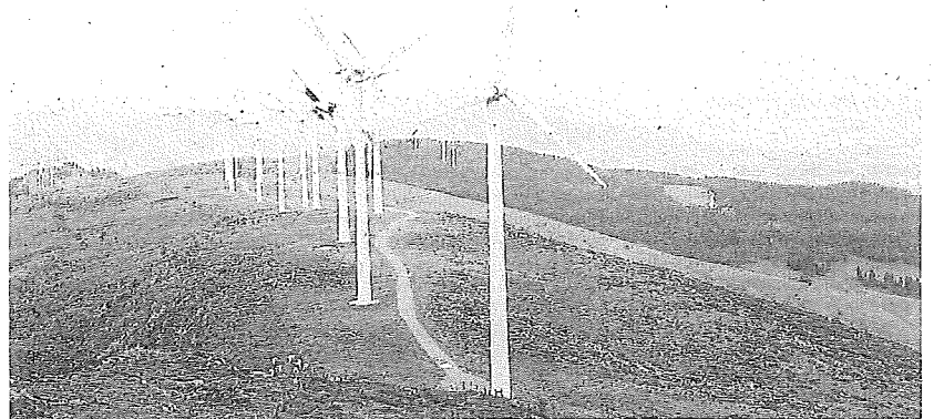
Parque eólico.

total de 26 han sido ya publicados y la gran mayoría más del 80% se encuentran en fases muy iniciales del proceso, que, dependiendo de su tamaño y ubicación, puede durar unos meses o hasta dos y tres años, en caso de existir cuestiones de afección medioambiental, urbanística o vecinal. ● Recorrido. Esto hace, precisamente, que muchos de ellos no prosperen, especialmente los que no están convenientemente diseñados. Aproximadamente, el 27% de los proyectos tienen una potencia inferior a 5 MW. Y, entre los que tienen una potencia superior, la media se sitúa en los 30 MW en el caso de los eólicos y en los 37 MW en el de los fotovoltaicos. El PTS de Renovables identifica 110 emplazamientos como "idóneos" para la posible construcción de estos parques, 57 de ellos de energía eólica y 53 de energía solar.