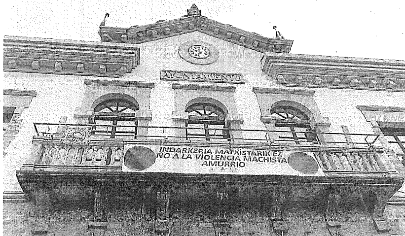
Fachada del Ayuntamiento de Amurrio con una pancarta contra las agresiones machistas.

Asimismo, desde la Comisión de Igualdad han reiterado su firme