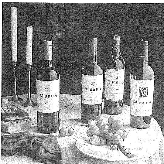
Los vinos premiados.

Las uvas tempranillo y graciano destinadas al vino Veguín de Murua Gran Reserva 2016 se seleccionan