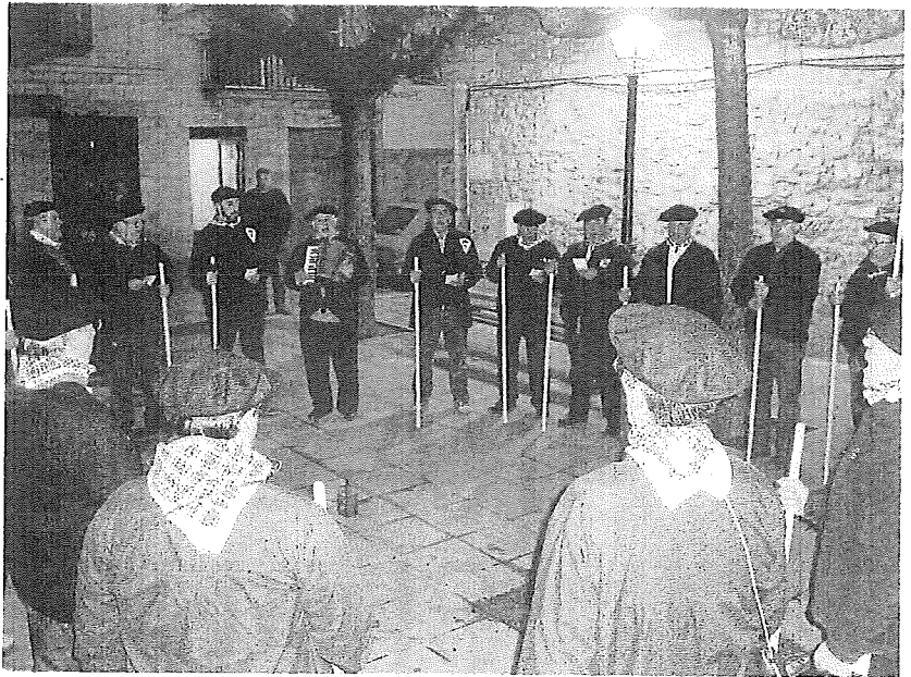
Imagen de archivo de los coros de Santa Águeda en Agurain.

Antiguamente en la Llanada se cantaba: "Esta noche de Santa Águeda / por no poderlo olvidar / hemos salido de ronda / los mozos de este lugar / como los antepasados / solían acostumbrar / y para que los venideros no lo puedan olvidar". En la actualidad ya se entona: "Aintzaldun daigun Agate Deuna / bihar da ba Deun Agate / etxe honetan zorion hutsa, / betiko euko al dabe. / Deun Agatena batzeiko gatoz / aurten be igazko berberak / igaz lez hartu gagizun eta / zabaldu zuen sakela. / Aintzaldun daigun Agate Deuna / bihar da ba Deun Agate / etxe honetan zorion hutsa / betiko euko al dabe. / Orain bagoaz alde egitera / agur dautsugu gogotik / Agate Deuna bitarte dala / ez eizu izan dongerik... EUPH!".