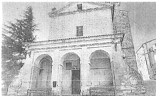
Iglesia de la que se va a retirar la placa.