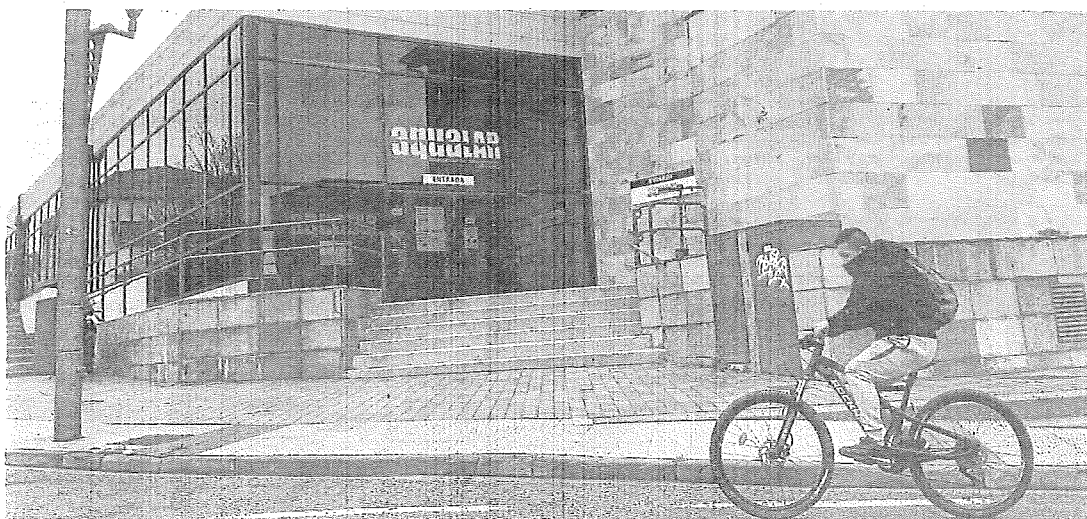
Un ciclista circula por la avenida de Entrena de Lardero, con el complejo deportivo Aqualar que gestiona Ocio Sport Rioja al fondo.