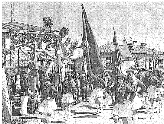
Tamborrada de 2024 en Dulantzi.

El reparto de tambores tendrá lugar esa misma jornada, de 17.00 a 18.00 horas, en los vestuarios de las piscinas; y, tras el desfile, habrá que devolver los tambores y barri-