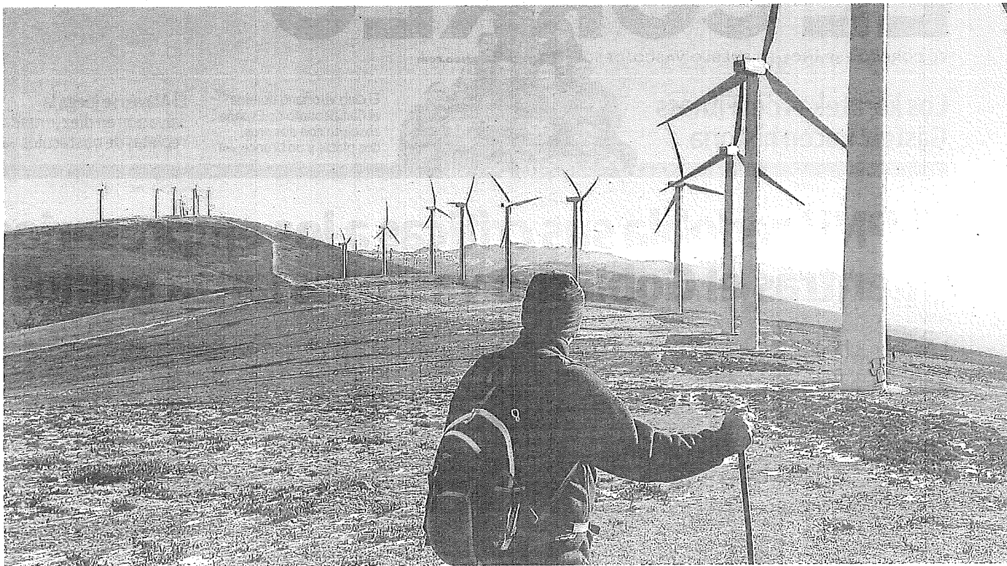
Los aerogeneradores de Capital Energy se suman así a los planes de Aixear, la empresa que comparten el Gobierno vasco e Iberdrola, para hacer otros dos parques eólicos en Labraza y Azaceta. E.