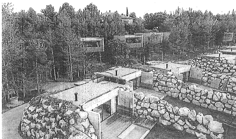
Vista del Noctis Hotel de Soria, cuyo concepto tratarán de extrapolar al viejo complejo.

Según ha podido confirmar EL CORREO, el grupo empresarial madrileño Abdón adquirió en diciembre esta parcela de 58.000 metros cuadrados a la entidad financiera vasca con el objetivo de recuperarlo como un lujoso hotel y un restaurante situado en la 'muga' entre Rioja Alavesa y Lo-