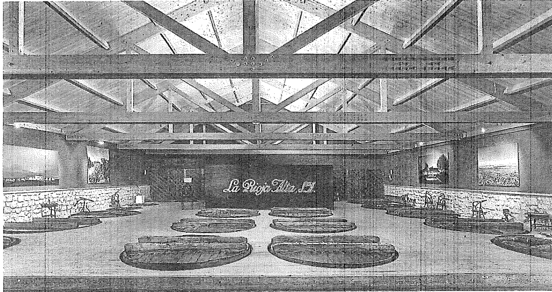
Nave de antiguos tinos de madera de La Rioja Alta, SA, que entra el podio de Drinks International. LN