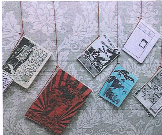
la 400 fanzinez betetako bilduma ondu dute. LURPEKO KAIAERAK

Eta fanzineek zein paper dute horretan? Ez dira egungo ohiko baliabidea. Nik uste dut gaur egun kapitalismoak gure eskura jarri dituela teknologia asko, eta haien helburua dela gure gaitasun mentala edo argitasuna murriztea. Scroll etengabea egitea Instagramarekin, gure atentzia murriztea, eta fanzineek horren kontrakoa ematen dute, beste erritmo batean doaz. Fanzineak sortzea, idaztea, maketatzea... edo lehen egiten zen bezala, moztea, pegatzea... Eta baita irakurtzea ere, artikulatu bat, narrazio txiki bat edo poema bat. Uste dut hein handi batean dela kapitalismo heteropatriarkalaren kontra egitea, ezarritako bizimoduaren kontra. Eta bestetik, kontrakomunikatzeko erreminta oso potentea dela, gure gauzen inguruan hitz egiteko eta partekatze.