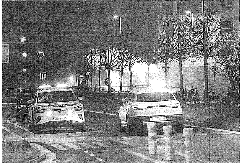
El incendio de Arkaiate estropeó el sistema de recogida neumática de basura de Salburua.

Sin embargo, el plazo para arreglar el sistema se redujo, por lo que al final, únicamente se colocaron contenedores de envases y papel y no de materia orgánica. "Los marrones había que pedirlos e iban