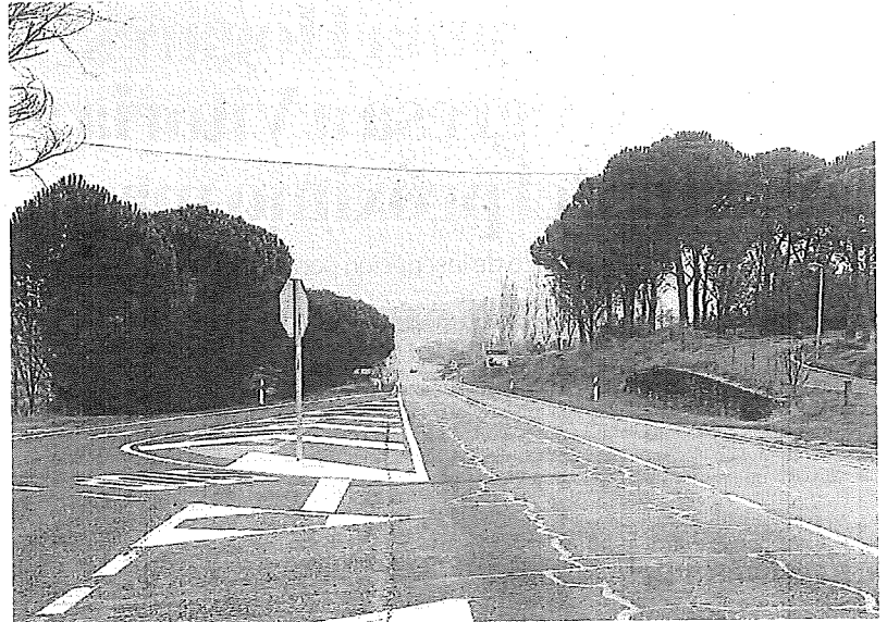
El complejo cruce de Leza.

De hecho, la presentación de este informe ha suscitado críticas por parte de EH Bildu, que reprocha al Gobierno Vasco que haga balance de algo "que aún no se ha aprobado", pues recuerda que lo que se acordó el pasado mayo en la Cámara alavesa fue "actualizar" el borrador del PEC, porque la situación de Aiaraldea "ha cambiado sustancialmente", han denunciado. —A.O./NTM