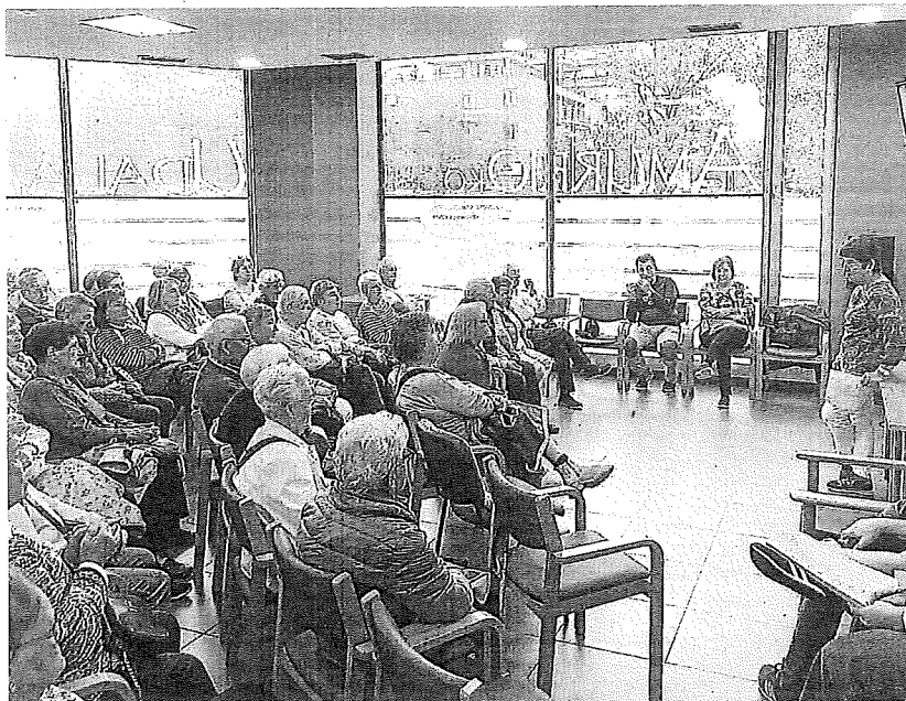
Asamblea del Consejo de Mayores en el Nagusi Etxea de Amurrio.

Asimismo, con la finalidad de consolidar una red de apoyo en la zona