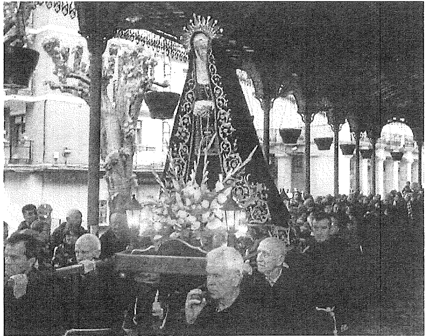
Procesión en Semana Santa en la localidad alavesa de Llodio.

MUCHA ACTIVIDAD EN LAUDIO Llodio contará con una amplia programación. El Jueves Santo, la Celebración de la Cena del Señor será a las 18.00 horas, seguida de una procesión con varios pasos y vigilia nocturna