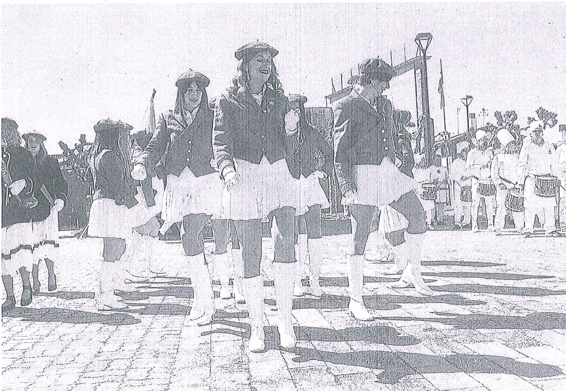
Tamborrada en Dulantzi en 2024.