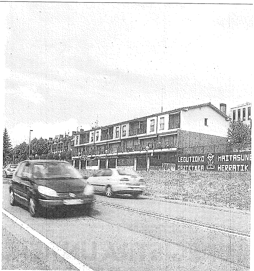
Varios vehículos circulan por la N-240, a su paso por Legutio. Foto: DINA

Además, va a iniciar este 2025 los trabajos de redacción de los proyectos de mejora de la A-124 entre Samaniego y Leza; la nueva carretera de conexión entre la A-132 y la N-104; la A-132 entre Villafranca y Egileta; la A-3226 entre Laserna y Oion; la A-3626 de acceso a Quejana; y las travesías de Artzniega y Yécora, proyectos para modernizar la red viaria del territorio y cuyas obras podrán ser licitadas "en próximos ejercicios". – DINA