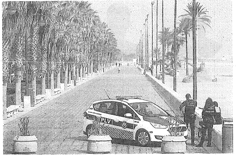
La Policía Local de Valencia patrulla en el paseo marítimo.

Las detenciones tuvieron lugar a primera hora de la mañana de ayer. Tras recibir el aviso de una agresión sexual en grupo, varias patrullas de la Policía Local de Valencia se desplazaron con urgencia al lugar para auxiliar a la víctima y buscar a los agresores. Eran las 07.26 horas del domingo cuando comenzó el operativo policial, coordinado desde la sala del 092, con la par-