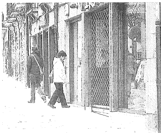
Una mujer viendo el escaparate de una tienda de Agurain.

"La digitalización es un elemento clave y debe sumarse a la colaboración entre los diferentes actores y una visión innovadora del relevo generacional. Apostar por un modelo comercial humano, adaptado y resiliente es, en última instancia, apostar por la vida y el futuro del medio rural vasco", subraya este estudio. — A.S.