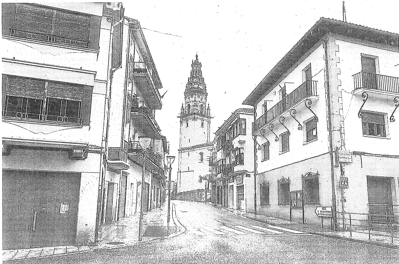
Panorámica del centro urbano de Oion.

Si hay más de un solicitante que opte a la misma vivienda, se priorizará a quienes estén empadronados o trabajen en el mismo núcleo de población, seguidos por aquellos que lo estén en