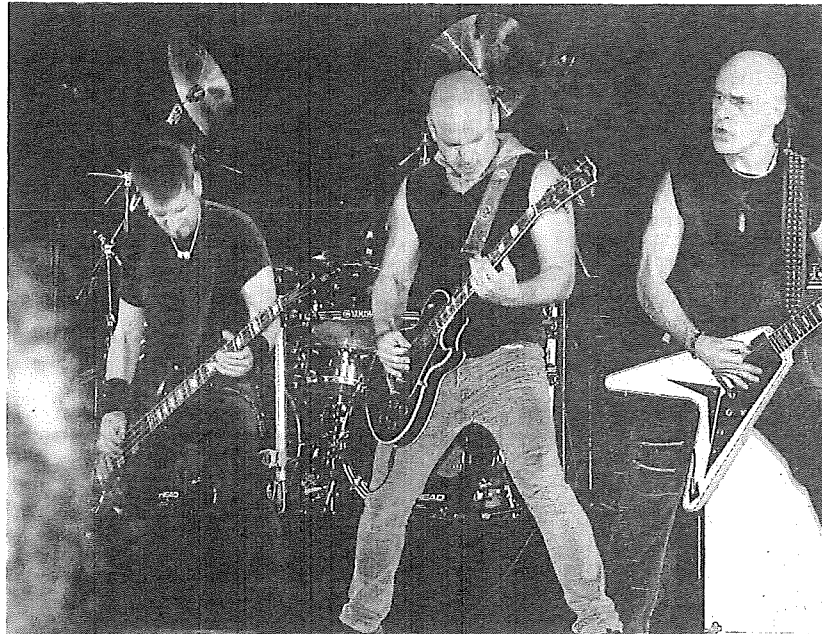
Pie de foto.

En cualquier caso, el concierto del día de las Cuadrillas -las opciones a votar eran S.A., Mago de Oz, Lendaris Muertos, Ladilla Rusa y Leon Benavente- no se desvelará hasta junio. Mientras, para el primer sába-