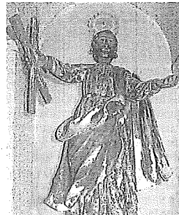
Escultura en Dordoniz. e. c.

La restauración de una indumentaria regional de Elciego (2.226 euros) es una de las piezas más llamativas. Se trata de tres faldas vinculadas a la danza y realizadas con hilos metálicos, tintes, pigmentos. «Son históricas, no se utilizan y se res-