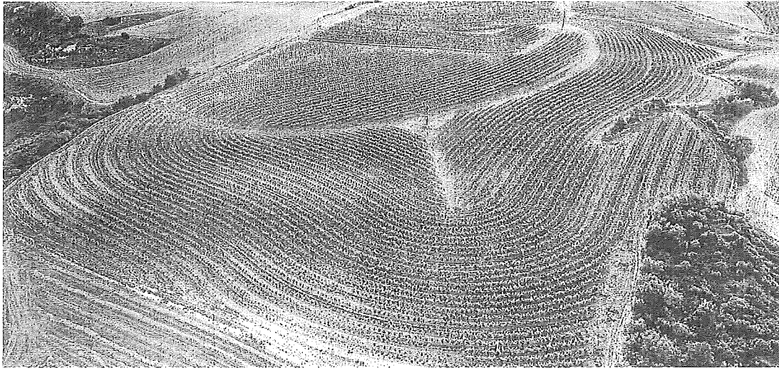
Espectacular imagen aérea de la plantación en key line de Bodegas Roda en Cellorigo. v. r.