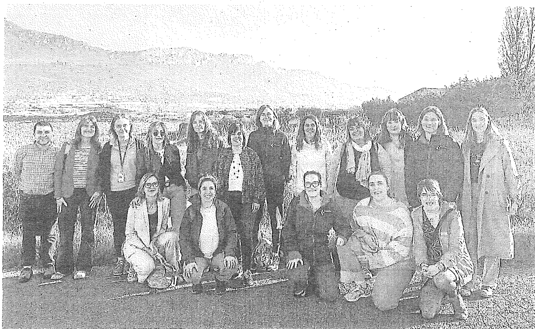
Profesionales de Osakidetza participan en Bidelagunak, un programa de paseos saludables que invita a recorrer diferentes rutas.

Así es como surgió esta experiencia que, con la excusa de pasear y recorrer estos bellos parajes entre viñedos, propone a todos sus participantes un buen rato de actividad física (complementada con la realización de ejercicios adaptados antes y después del paseo), además de dinámicas para el bienestar emocional y mejora de las relaciones interpersonales. Además, en cada cita semanal, los paseantes cuentan con la dinamización de los diferentes profesionales de Osakidetza que van tomando parte: desde médicos y enfermeros, pasando por fisioterapeutas, farmacéuticos, administrativos... Les acompañan en sus recorridos sumando en cada caso charlas divulgativas y didácticas sobre diferentes temas que van surgiendo alrededor de la salud física y mental. Y no solo eso, lo enriquecedor de estos paseos saludables es que todos los asistentes se animan también a la hora de compartir experiencias, conocimiento e historias de años y décadas pasadas en algunos casos.