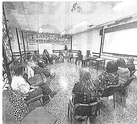
Una de las citas de esta edición.

Asimismo, se han dado a conocer distintas situaciones y vivencias de las mujeres migradas; se han analizado los nuevos tipos de prostitución derivados de la digitalización; se han compartido las experiencias de las personas LGTBIQ+; se ha puesto sobre la mesa las aportaciones de las mujeres artistas en el arte y la invisibilidad que han sufrido; y se ha podido ver la obra "La mufeca articulada", creada por las mujeres del pueblo junto a KuluXka Antzerkía, entre otros. – A.O./NTM