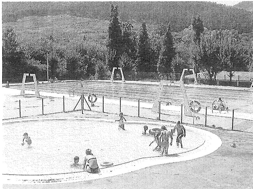
Piscinas municipales de Okondo.