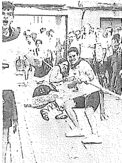
Día Blusa en Oion.

Por lo demás, el particular Día del Blusa de Oion seguirá el guión de pasadas ediciones, comenzando con la venta de pañuelos y un mercado de artesanía, al que le seguirá la animación callejera con la txaranga Gazteberri y la foto de rigor, antes de acudir a la comida popular. Ya a la tarde, a partir de las 17.30 horas, llegarán los torneos de mus, fútbolín, tute, dardos, poker o sokatira a los bares, así como otros juegos populares a las calles, que desembocarán en el recital de flamenco con Los Hermanos de Olga. A la noche seguirá la fiesta con sorteo, toro de fuego y más música con Oiongo Blusa Night. —A.O./NTM