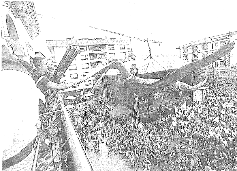
Bajada de Iguarrako en las fiestas de Amurrio.

FINALES DE AGOSTO Unos días más tarde, será el turno de Angostina en honor a San Bartolomé (24 de agosto) y también de Virgala Mayor, en honor a la Virgen del Rosario. Asimismo, cerca de una veintena de pueblos completan el calendario festivo de este mes de agosto; Oyón, Domaitia, Okondo, Lagrán, Viñaspre, Baños de Ero, Urrunaga, Ribabellosa, San Vicente de Arana, Baro-