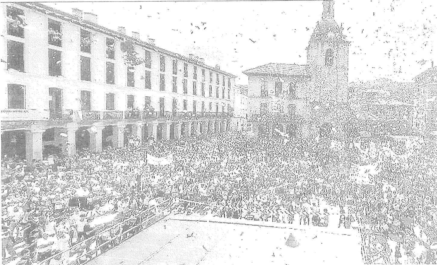
La Herrilto Plaza de Laudio inundada de confeti en el lanzamiento del txupinazo que daba inicio a los Sanrokes de 2024.