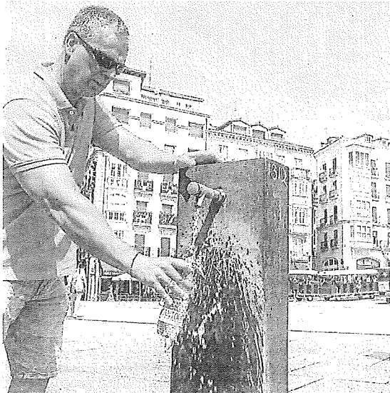
Un vecino rellena su botella de agua en una fuente de Gasteiz.