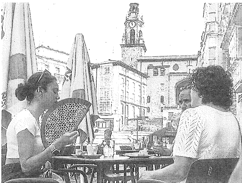
Una familia descansa del calor en la sombra de una terraza, en Vitoria.

GRADOS De temperatura máxima sobrellevaron ayer los poco más de 400 habitantes en el pequeño núcleo rural de la Cuadrilla de Añana.