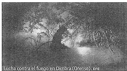
Lucha contra el fuego en Olmbra (Orense).

Fuego. El Gobierno declarará zona catastrófica las áreas incendiadas P36