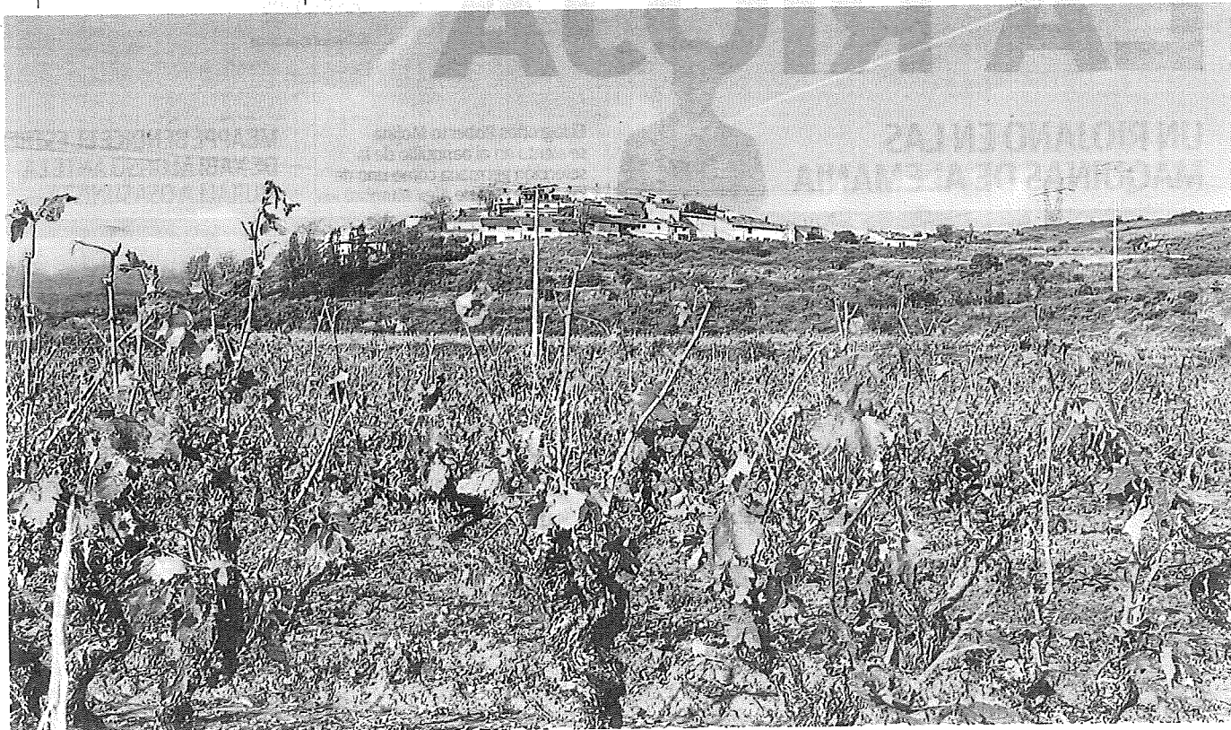
Viñedos arrasadas en Hornos de Moncalvillo, con la localidad al fondo, tras la tormenta del pasado mes de junio. A. H.