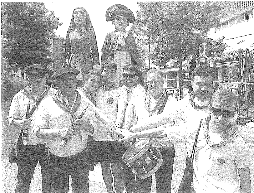
Los músicos de 'Haize Doinu' junto a los portadores de Don Terencio y Doña Tomasa en Llodio. JESÚS ANDRADE

Los 'Sanroques' de Llodio vuelven tras un pequeño descanso el sábado, cuando se podrá disfrutar de la comida del 46 Concurso Gastronómico de la mano de la cuadrilla Rakataplá a partir de las 8.00 horas. A la tarde, a las 16.00 horas, se podrán ver los mejores vehículos clásicos y deportivos en la calle Zumalakarregi, acabando la jornada con el teatro itinerante 'Finito-Infinito' de la compañía Trotamundo en la plaza de Lamuza.