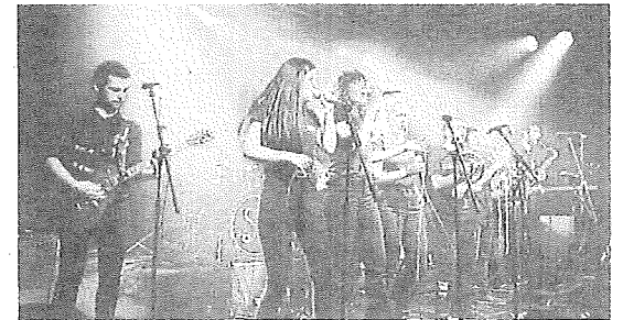
El grupo Skabidean actuarán el sábado en Lagrán. E. C.