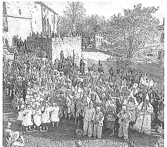
Maskaraba celebró su primer encuentro en Zaldondo.

Asimismo, se contó con símbolos del disfraz y la tradición en Rioja Alavesa, tales como el famoso Katxi de Oion y el Katximorro de Laguardia, que llegó de manos de su asociación de danzas. Para el nuevo encuentro no se han avanzado más detalles, aunque es de suponer que volverá a incluir un amplio programa con la magia de todas estas ancestrales manifestaciones culturales como protagonistas. —A.O./NTM