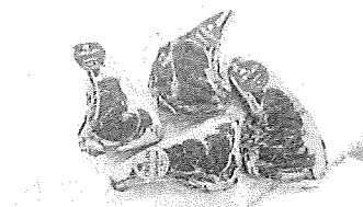
Puedes encontrar chuletas de Okelan envasadas al vacío.

ductos que comparten la filosofía de calidad, sabor y comodidad. Ejemplo de ello son las espectaculares chuletas de Okelan envasadas al vacío en piezas de medio kilo y un kilo para