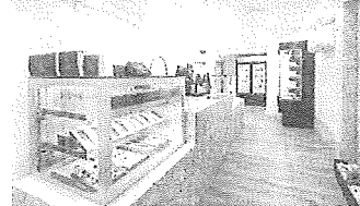
La renovada tienda ha ampliado la oferta gastronómica.

ductos que comparten la filosofía de calidad, sabor y comodidad. Ejemplo de ello son las espectaculares chuletas de Okelan envasadas al vacío en piezas de medio kilo y un kilo para