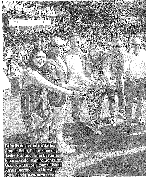
Brindis de las autoridades.

comentó antes de describir a los vecinos de la comarca como «trabajadores y humildes». «En los momentos difíciles es cuando surgen las mejores ideas.