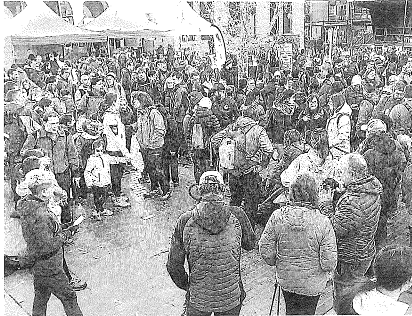
Público en la Plaza Juan Urrutia de Amurrio durante la Babio Igoera de 2024.

Pues bien, a esa red acaba de incorporarse la famosa Babio Igoera de Amurrio. Todo un clásico de la mañana de nochebuena, impulsado desde asociaciones locales como Amurrio Trail o Ezina Elkinéz Egina, con la que desde hace nueve años se ayuda a hacer cima a personas que por sí mismas no pueden hacerlo, al tiempo que se recaudan fondos para una causa social que, este 2025, será la de Apafai.