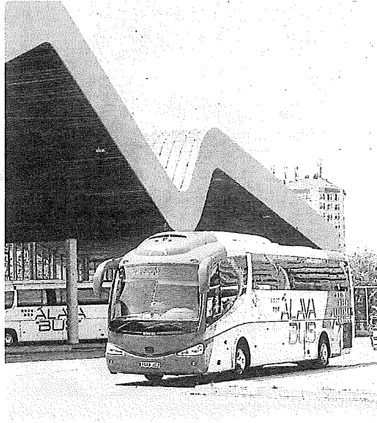
Un autobús de la Diputación Foral de Álava.

HORARIOS DE IDA Y VUELTA El nuevo servicio contará con tres expediciones diarias por sentido, de lunes a viernes, con salidas desde Orduña a las 7:00, 10:00 y 13:00 horas, y regresos desde el Hospital de Galdakao a las 8:15, 11:15 y 14:15 horas. Estos horarios se han diseñado para adaptarse de forma escalonada a los turnos de consultas médicas y pruebas diagnósticas del centro sanitario.