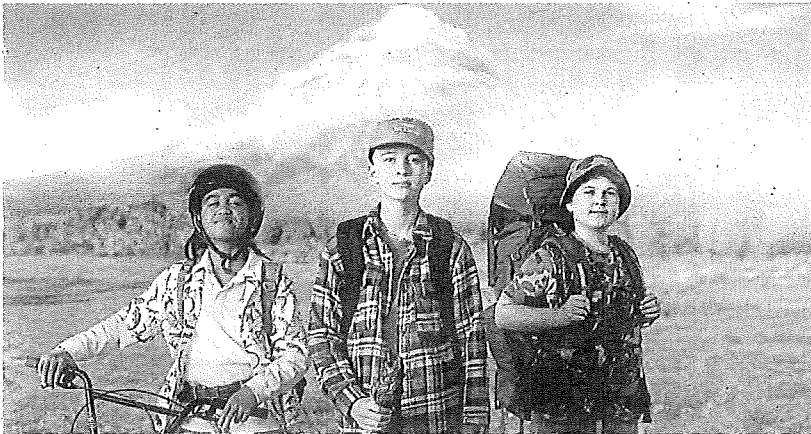
Las entradas para ver películas como 'The Mountain' se pueden adquirir en la web del festival. e. c.