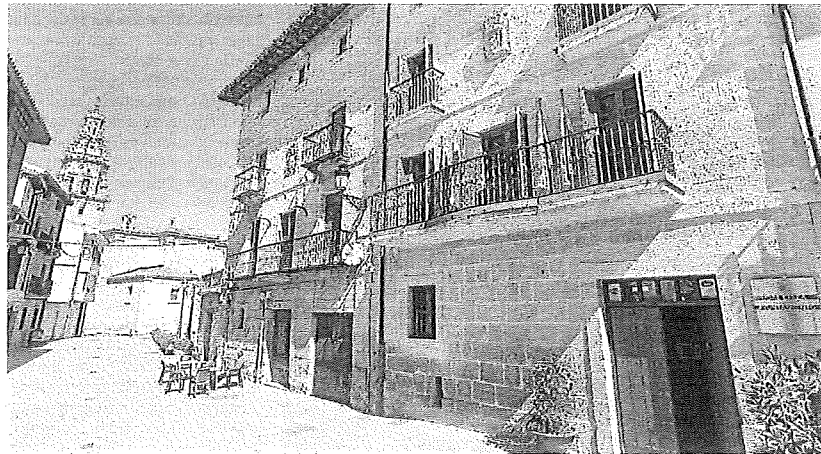
Entrada al Ayuntamiento de Oion.