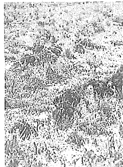
Cultivo ecológico.

El tercer eje, BIDERBI, agrupa las actuaciones ligadas a la transición ecológica, la sostenibilidad y la agricultura ecológica, así como al impulso de una agricultura y una gestión forestal más tecnificadas y digitalizadas. La Diputación destinará 3,65 millones. Aguirre señaló que "la diversificación, la innovación y la sostenibilidad serán determinantes para el futuro del sector, y el impulso a una agricultura y gestión forestal digital es esencial para reforzar su competitividad". —DNA