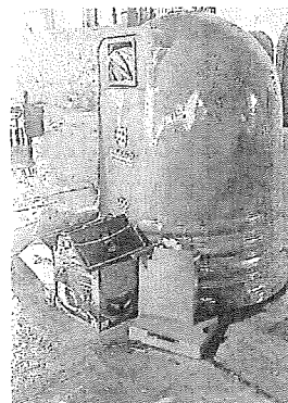
Contenedor a rebotar.

El Ayuntamiento prevé además que la situación vaya a peor con las Navidades y asegura sentirse "impotente" para dar explicaciones, "máximo cuando venimos de aprobar unas ordenanzas de recogida de residuos con importantes subidas, ya que la situación echa por la borda cualquier argumento", ha trasladado el regidor. "Por tanto me dirijo a