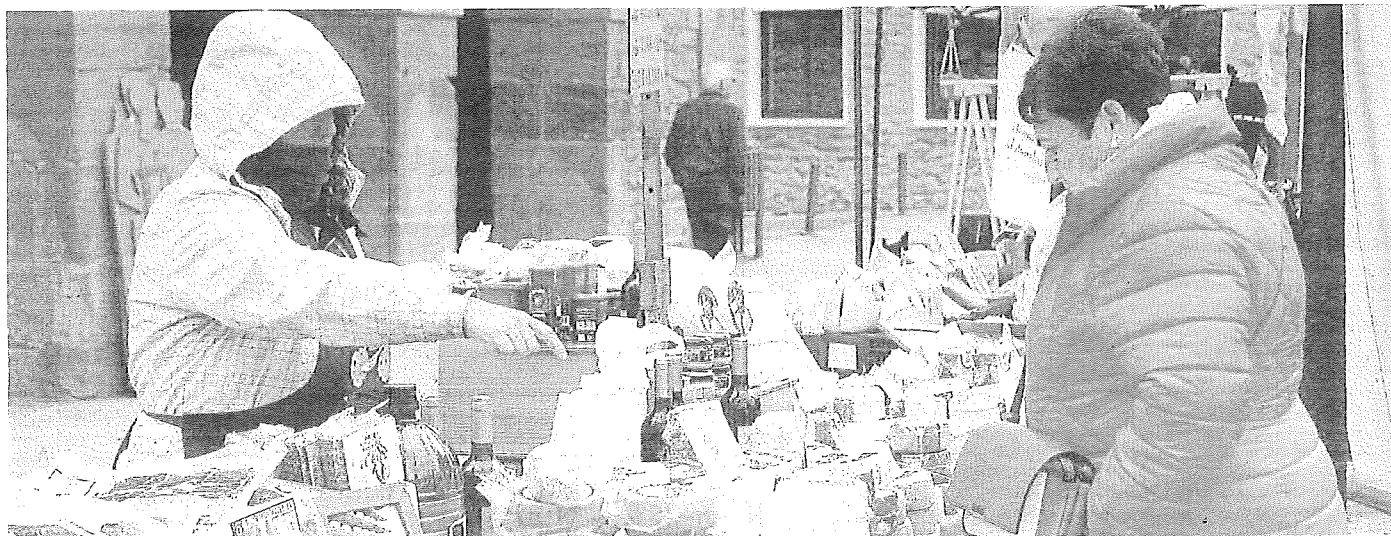
Celebración de San Blas en Dulantzi.