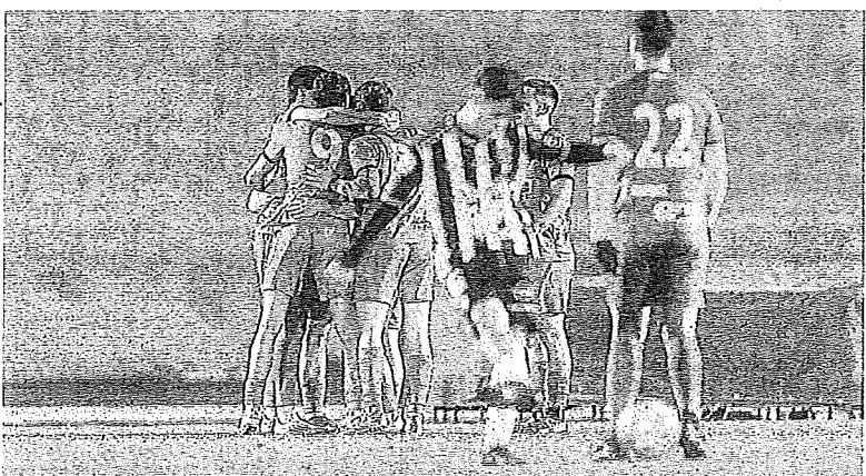
Jugadores de La Calzada celebraban un gol ante un jugador jarrero. BOUZÉAR