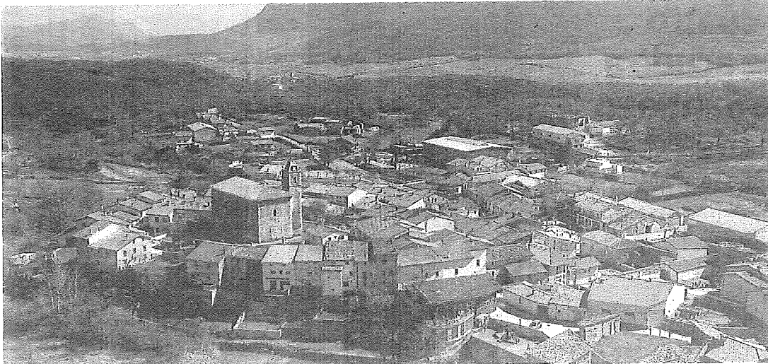
Vista aérea del municipio alavés de Lagrán.