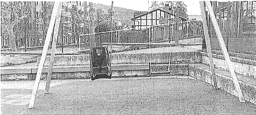
Detalle del nuevo columpio inclusivo instalado en el patio de Mendiko Eskola.

Ya el pasado mes de octubre fue objeto de renovación el área de recreo infantil, ubicada en la parte alta del parque Juan Urrutia, donde se reemplazó un elemento de juego que había resultado dañado y se renovó por completo su pavimento. A ello se sumó en noviembre la renovación integral del parque infantil de Boriñaur-Landako. ●