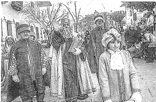
En Amurrio, el recorrido a pie comenzó a las cinco de la tarde. B. CASTILLO