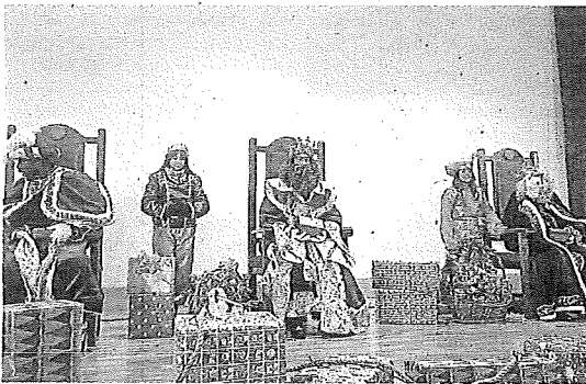
En Oion, Melchor, Gaspar y Baltasar terminaron en el cine. E. C.