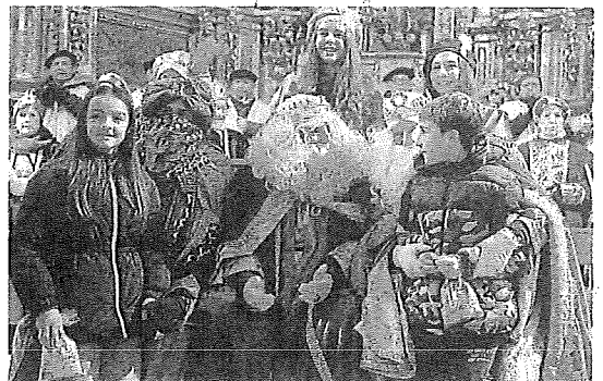
Los monarcas arrancaron en Trespuentes su recorrido por Iruña de Oca. E. C.

después ir a Villodas, Montevite y Trespuentes antes de llegar a Nanclares. Allí, los Reyes recibieron a los niños en el frontón.