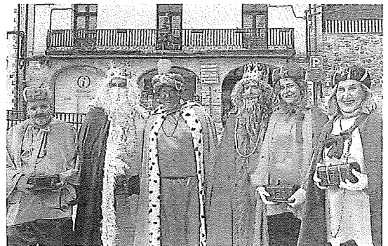
Sus Majestades también pasaron por Salinas de Añana. E. C.