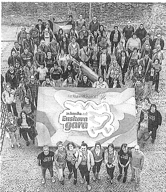
Foto de familia de la presentación de la Korrika.

Esta primera incursión en territorio vizcaíno (habrá un total de tres) durará más de veinticuatro horas y los participantes