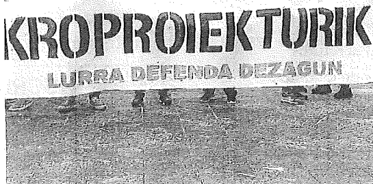
Concentración en la Plaza de la Provincia.

Por último, la plataforma expresó su rechazo a lo que considera una utilización "engañosa" del concepto de transición energética y animó a la ciudadanía a organizarse y participar en la defensa del territorio, con especial atención a las zonas que consideran más amenazadas, como Labraza.