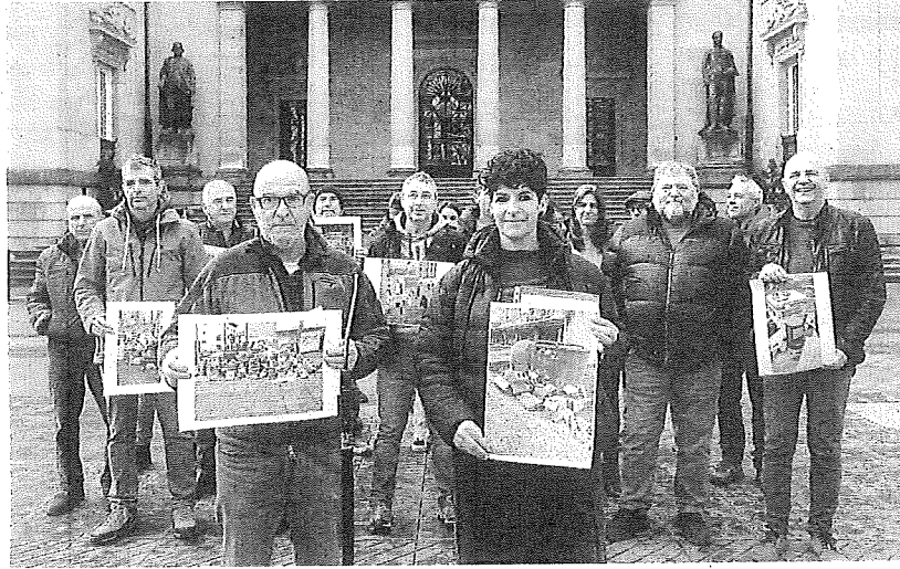
Alcaldes de los distintos ayuntamientos mostraron imágenes de contenedores desbordados. BLANCA CASTILLO

Estos municipios, gobernados por formaciones independientes o por EH Bildu, exhibieron imágenes de contenedores desbordados tras haberse reunido con la Diputación «deprisa y corriendo» el martes. Cargaron contra el Ejecutivo foral al asegurar que el servicio «ha empeorado notablemente» en los seis meses en los que Garbaldi lleva desempeñando estas funciones tras el cambio de empresa adjudicata-