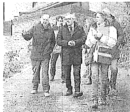
Visita institucional al concejo.

La intervención, en la que la Diputación ha invertido 765.380 euros, moderniza el ciclo hidráulico del concejo