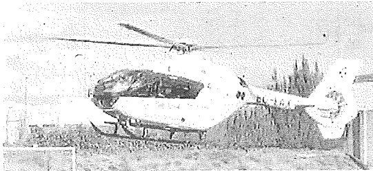
El helicóptero de Osaldidetza, a punto de llegar a Oion.

El pequeño fue trasladado en helicóptero al Hospital de Cruces desde el campo de fútbol del pueblo