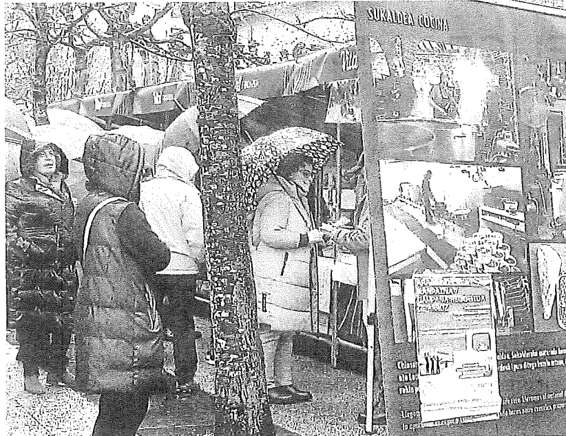
Puesto informativo de la labor de Zaporeak en Lesbos este pasado enero en Amurrio.

Desde la Cuadrilla de Aiaraldea queremos hacer un llamamiento a la ciudadanía para que participe en esta iniciativa solidaria, recordando