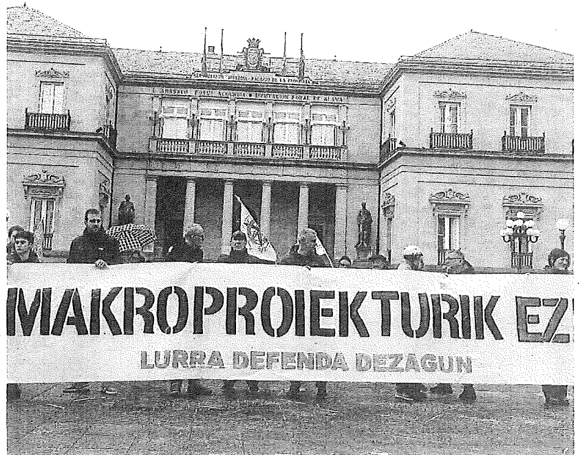
Concentración en protesta por la planta de Labraza.

Con vistas a futuro, el Ayuntamiento de Rioja Alavesa espera definir un modelo y unas condiciones que puedan ser "referenciales" para futuros proyectos y que "ayuden" en la lucha contra el cambio climático, la transición ecosocial y la descarbonización.