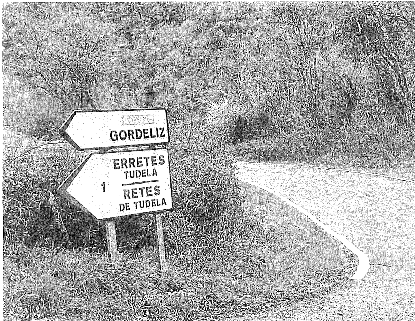
Carretera que conduce de Artziniega a los concejos de Gordeliz y Retes de Tudela.

El presupuesto de la obra se estima en 4.983.878,46 euros, IVA incluido, y su plazo de ejecución es de 12 meses. El Ayuntamiento se ha